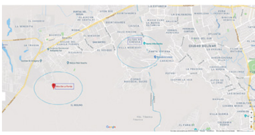
Figura 2. Geolocalización de los Altos de Cazucá y de los Altos de la Florida

Fuente: elaboración propia con base en Googlemaps. (representación generada el 10/09/2018).