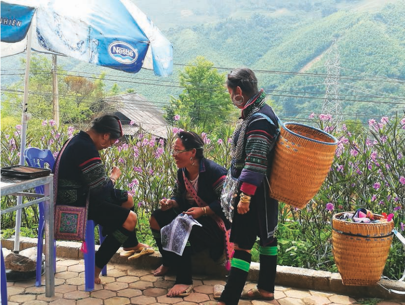
Fig. 1. Photographie de femmes hmong noir

L'ethnie hmong qui constitue l'objet de cette note de recherche représente la cinquième ethnie la plus nombreuse du Vietnam. Les Hmong du Vietnam se répartissent en six sous-groupes qui se distinguent par la couleur de leurs vêtements traditionnels (Cooper et al. 1996) : les Hmong blanc, les Hmong bleu, les Hmong à cordon, les Hmong à fleur, les Hmong noir (voir fig. 1) et les Hmong rouge.