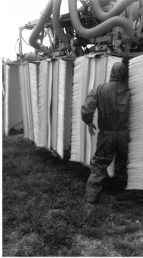
Figure 5. Action sur une buse bouchée par le chef de l'exploitation 1. Figure 5. Action on a plugged nozzle by the head of the farm 1.

du joint de vitrage permettant de relier la cabine au matériel de traitement. Ce joint est amené à se dégrader face aux conditions météorologiques (UV) et à l'interaction avec les produits chimiques. Cela entraîne des situations d'exposition directe aux pesticides par la contamination de l'air à l'intérieur de la cabine.