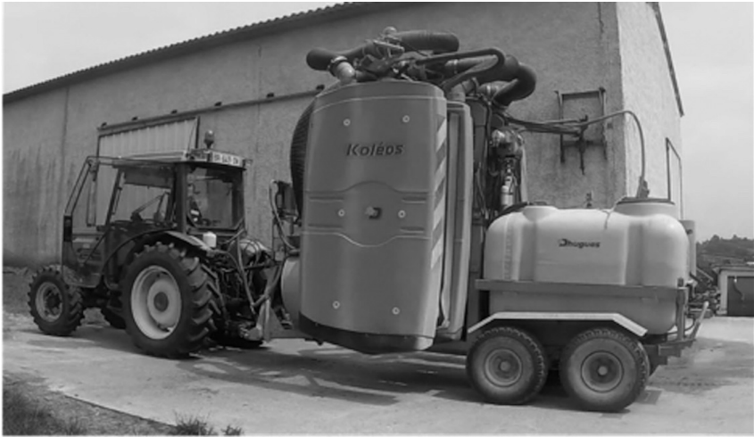
Figure 3. Pulvérisateur traîné de l'exploitation 2.