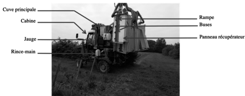
Figure 1. Pulvérisateur porté de l'exploitation 1 avec les principaux organes annotés. Figure 1. Mounted sprayer from farm 1 with the main annotated components.

Le matériel agricole dédié aux pesticides se révèle être un des déterminants techniques des situations d'exposition à ces produits (Lacroix et al. , 2013 ; Laurent et al. , 2016). Ce type de matériel est appelé « pulvérisateur » et sa fonction vise à projeter des produits sous forme de fines gouttelettes sur les cultures. Les pulvérisateurs sont constitués d'un ensemble d'organes indispensables à leur bon fonctionnement qui reste sensiblement le même d'un pulvérisateur à l'autre (cuve principale, cuve de rinçage, rince-main, jauge, manomètre, pompe, filtres, buses, rampes, cabine, etc.) (voir Figure 1). Les technologies de pulvérisation peuvent cependant différer. Des organes tels que le manomètre ou les filtres sont difficilement identifiables sur cette figure, car ils sont trop petits et/ou disposés derrière d'autres organes.