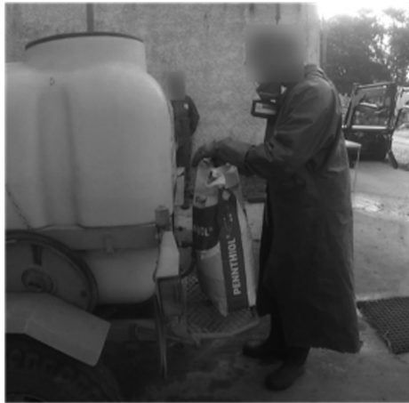
Figure 6. Catachrèse du marchepied réalisée par le chef de l'exploitation 2. Figure 6. Catachresis of footboard by the head of the farm 2.

« Disons que le sac je ne veux pas le poser par terre, si l'eau coule, le sac se mouille donc je n'aime pas » (Exp2, CE).