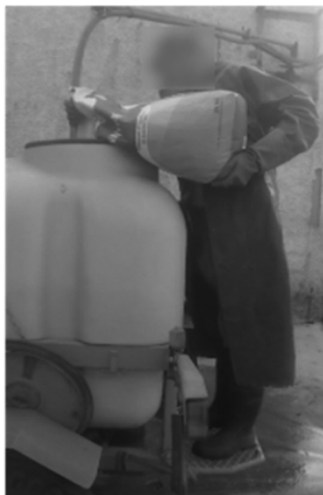
Figure 4. Incorporation des produits dans la cuve par le chef de l'exploitation 2. Figure 4. Induction of products in the tank by the head of the farm 2.

variabilités communes aux deux exploitations concernent les buses et filtres bouchés, les panneaux récupérateurs qui touchent le sol lors de l'application, la formation de mousse dans la cuve et les capteurs qui dysfonctionnent. Les similarités observées entre les deux exploitations peuvent également concerner les contextes d'usage et les usages. Par exemple, lorsqu'une buse se bouche lors de l'application des produits, cela demande aux agriculteurs de sortir de la cabine et de passer entre les panneaux récupérateurs pour nettoyer la buse. Cependant, compte tenu des différences entre les pulvérisateurs, une difficulté commune aux deux exploitations peut entraîner des usages différents. En effet, lorsque les panneaux touchent le sol lors de l'application des produits, le chef de l'exploitation 2 doit sortir de sa cabine pour les redresser tandis que le pulvérisateur de l'exploitation 1 possède une sécurité permettant aux panneaux de se relever automatiquement.