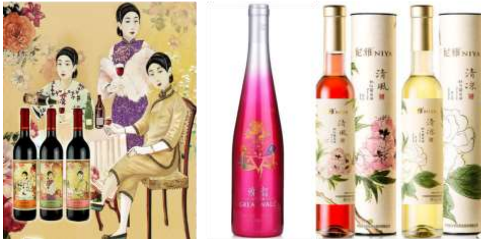
Figure 3 : Des produits de vin au style féminin

De gauche à droite : 1-3. : Série « dames élégantes » ( Changyu )