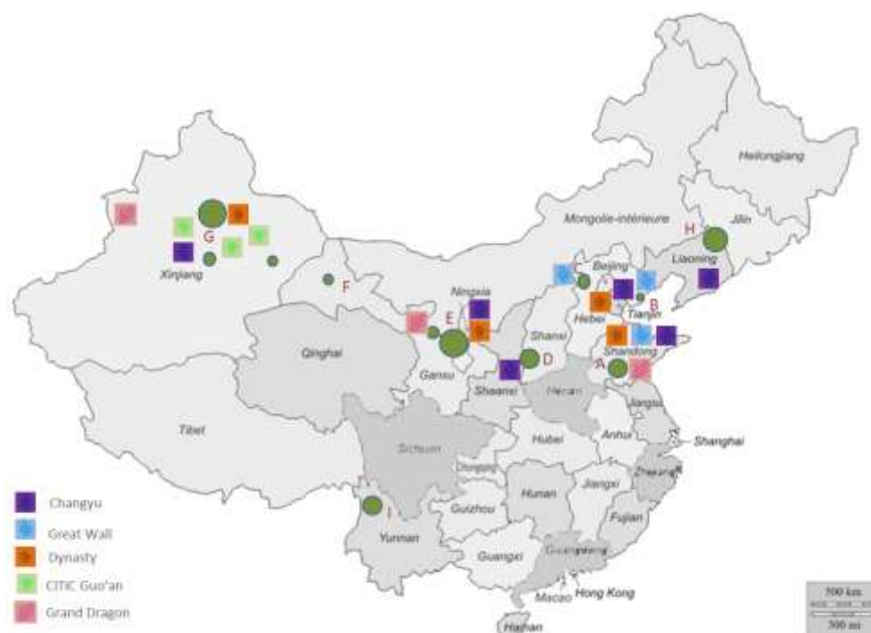
Figure 2 : Zones de production vitivinicole en Chine

commerciale, commencent à faire figurer le domaine de production sur le contre-étiquette.