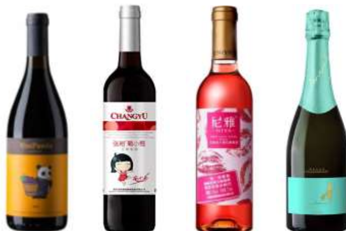
Figure 5 : Divers produits pour séduire les jeunes consommateurs