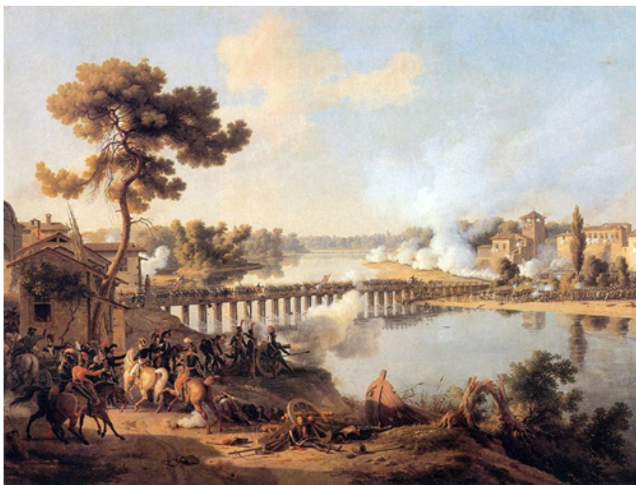
Louis-François Lejeune, La Bataille de Lodi , huile sur toile, 1804 (Musée de l'histoire de France à Versailles)

[...] l'attaque du pont est exécutée avec effet; en un mot, c'est du spectacle, c'est une pantomime qui peut piquer la curiosité par la manière dont elle est rendue. Tout le monde voudra voir des troupes, des canons véritables , une attaque, un combat à la mousqueterie, à la baïonnette; c'est un bruit d'enfer!... C'est un spectacle nouveau; il n'en faut pas d'avantage pour attirer tout Paris 22 .