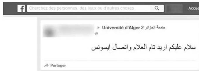
Figure 2 : Capture d'écran.