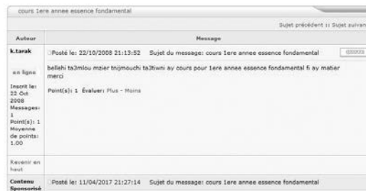
Figure 3 : Capture d'écran.

Le même phénomène est également remarquable dans le dialecte algérien pour lequel le mot « limonade » est réanalysé en li-monada > mūnāda (boisson) vs al-mūnāda (la boisson) au défini. C'est aussi le cas du mot indéfini gālizi qui provient du participe passé français « légalisé ». Le /l/ initial étymologique est éliminé car confondu avec l'article al- de l'arabe qui doit disparaître quand un nom est à l'état défini.